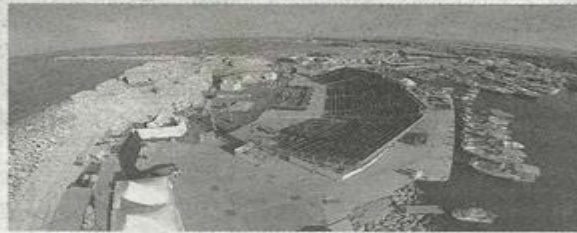
THE opera will be performed in front of Paphos Mediaeval Castle, a mock-up of the set is also pictured

Speaking recently during the festival an-